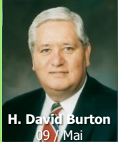
H. David Burton 09 / Mai