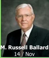
M. Russell Ballard 14 / Nov